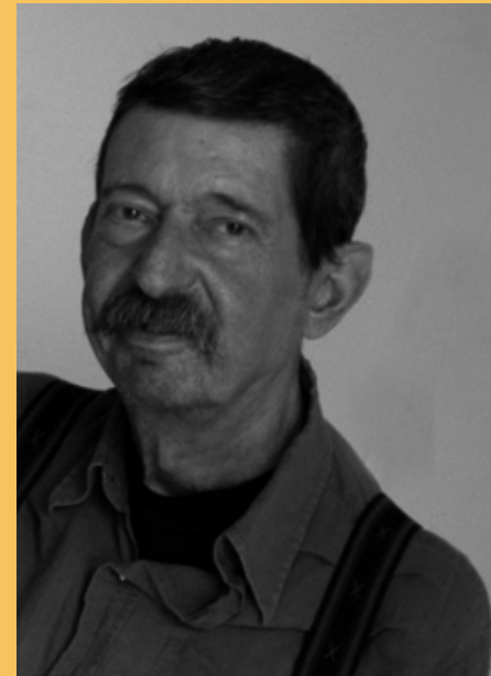
Jean-Luc Verley

Survivre est en effet aussi pour Hessie un besoin d'exprimer dans un état FIXE des signes et des formes qui se dégradent, s'effritent tout autour d'elle et cela donne à son travail un caractère obsessionnel qui rejoint celui de certains graffitis. Les signes qu'elle cherche à retenir sont en mutation permanente entre le choix, le rejet, la récupération en tant que déchet ou à partir du déchet. Comme elle le dit : "la survie est une mutation comme une autre", ou "la survie est inscrite dans le quotidien et sort de l'égout."